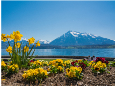
Bilder: Umgebung Thunersee

Wir freuen uns auf rege Teilnahme an unserer Ferienwoche. Gönnen Sie sich diese wohltuenden Tage im schönen Berner Oberland.